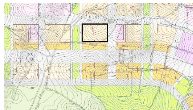
MANZANA 111, PARQUE DE VALDEBEBAS PLANO DE SITUACIÓN, E 1/20000